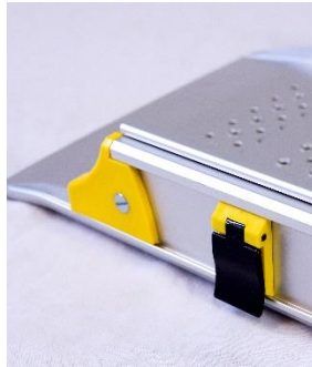
Lås teleskopisk del